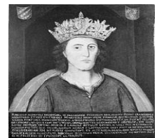
Deze foto van